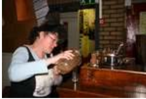
semifreddo van Sergio

Chocoladesoep 5 p serveer ik ook met soufflé glacé (uit gal&ria) die zoet, zuur, bitter, krokant & moelleux is!