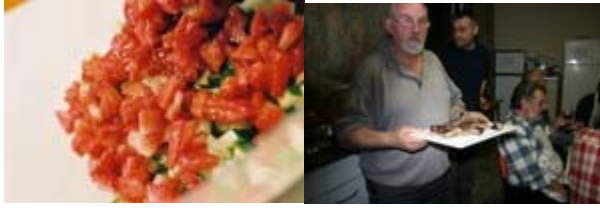
steak au poivre

Ik kocht een château Sainte-Marie (€ 6,55) bij gepeperde filet puur met cognacsaus & moest jam maken met de rest van 500 g aardbeien voor aardbei-komkommersalade, lekker & eenvoudig!