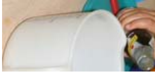
Texas Dry Gin

Ik kwam in "het Nieuwsblad Magazine" op het idee voor ijsgekoelde druiven uit kids in the kitchen bij granité van de Texasrakers , die ik voor the insiders niet uittestte met gin fizz.