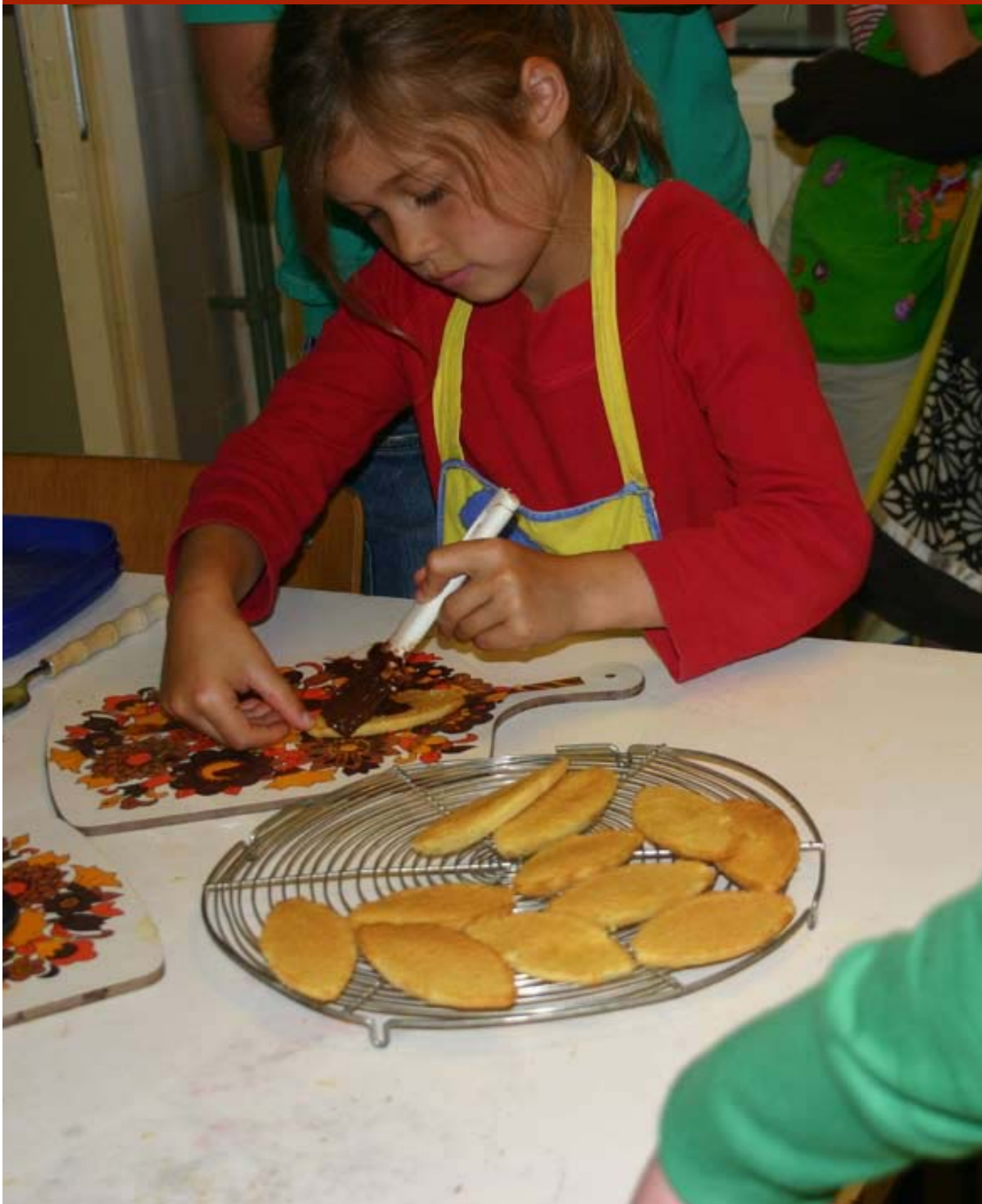
Zomerkoninkjes: fruitschuitjes[ 3 ]