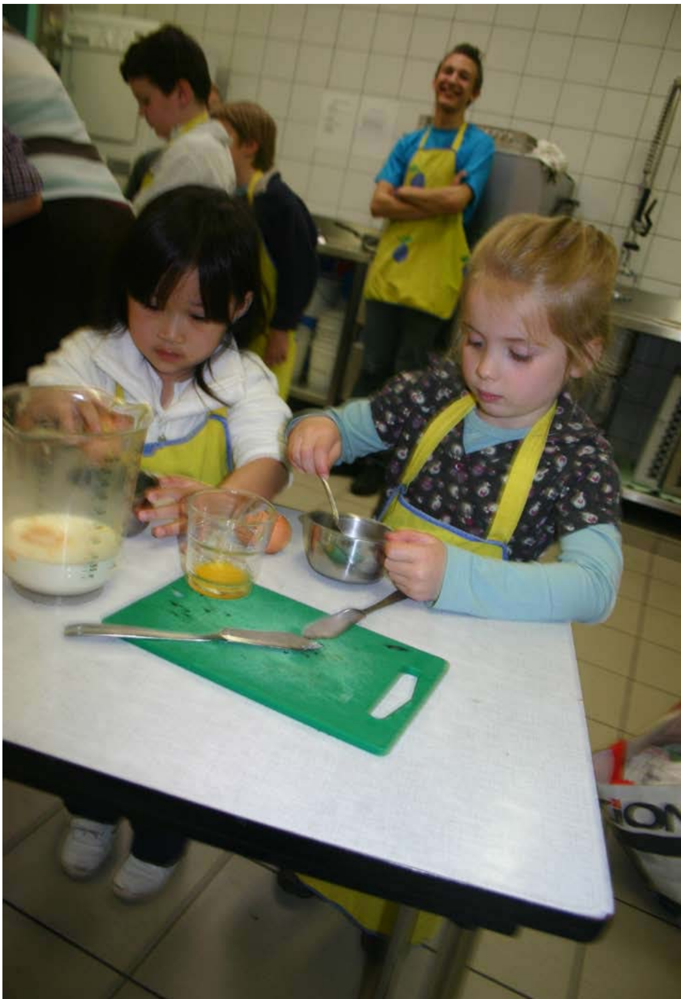
Recepten uit het Ketnet DOEBOEK