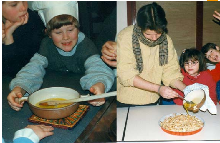
De kookavonturen van Kuifje