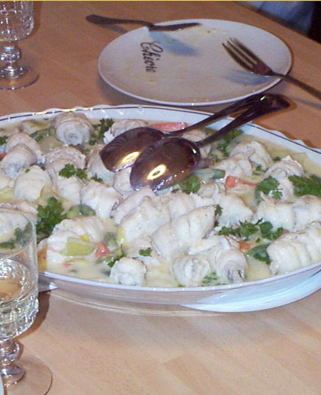
Koken in de lente ... [ 17 ]