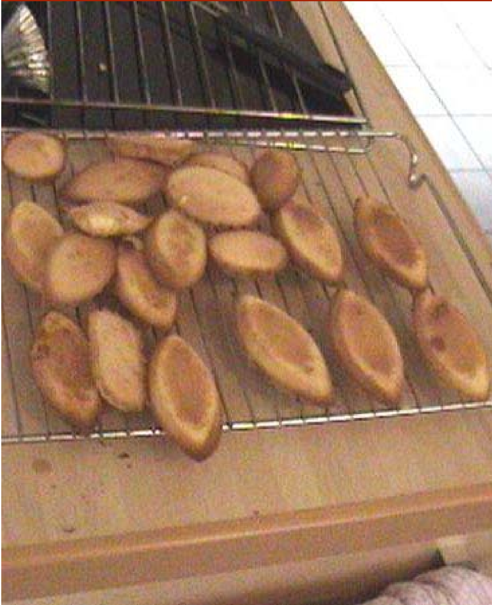
Carolientje (h)ee(f)t een bootje 3 ]