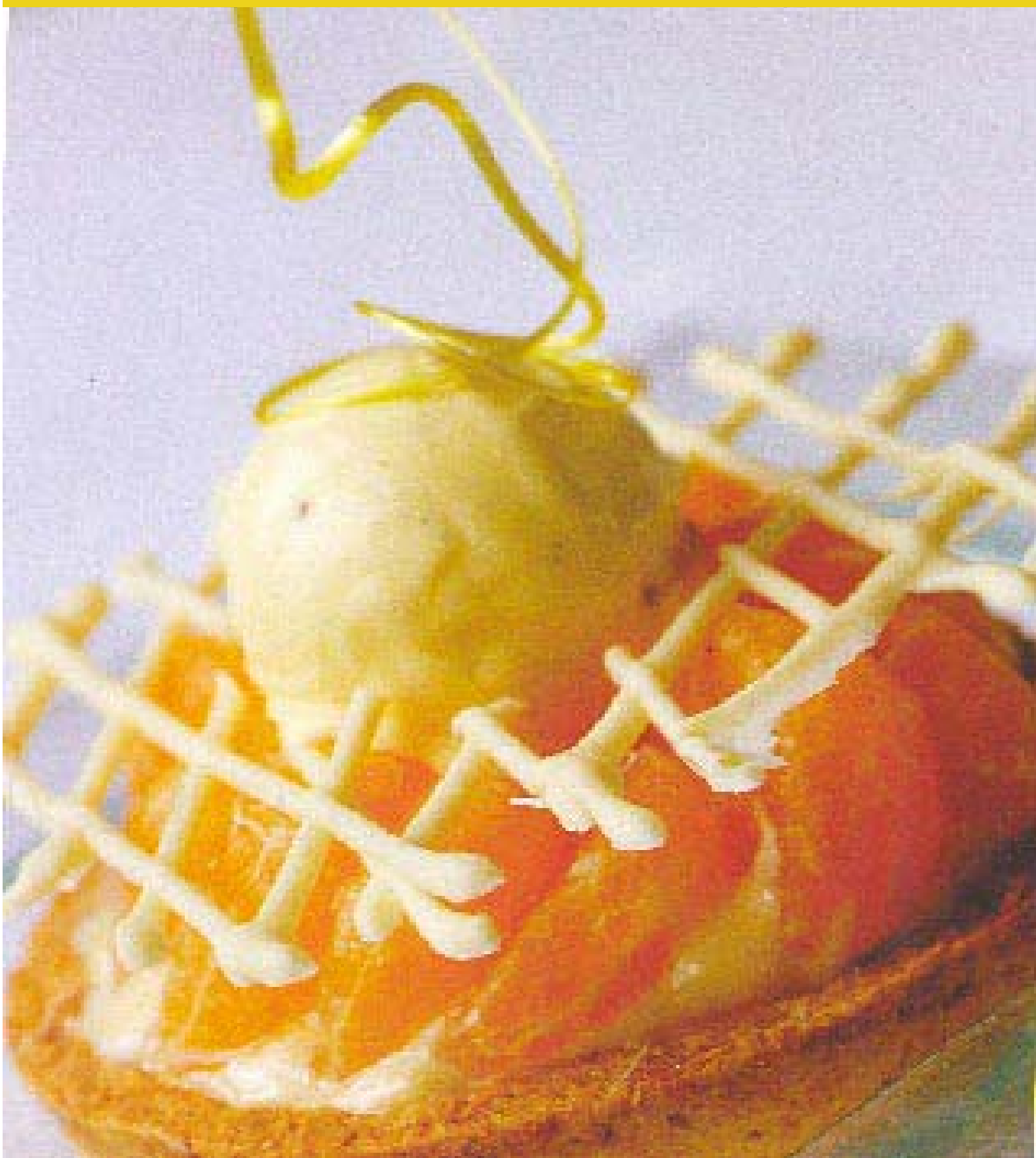
Carolientje (h)ee(f)t een bootje[ 3 ]