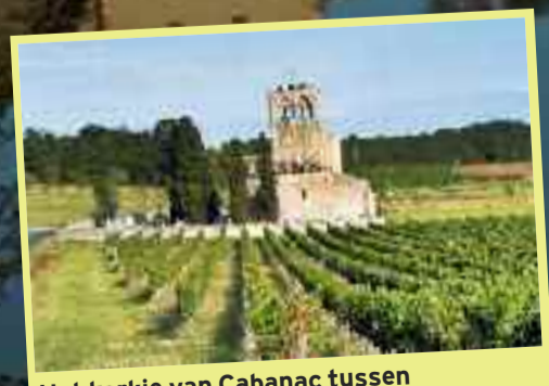
Het kerkje van Cabanac tussen de wijngaarden, vlak bij Mauroux.