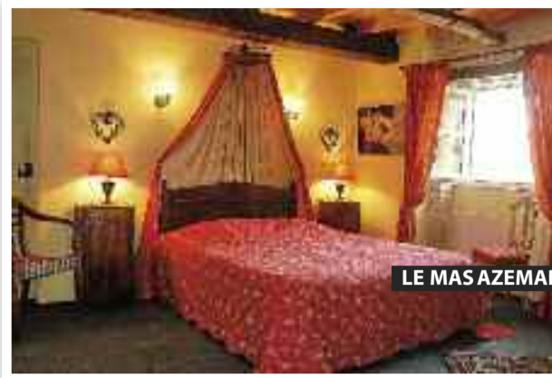
LE MAS AZEMAR