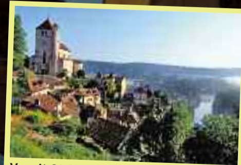
Vanuit St Cirq-Lapopie heb je een prachtig uitzicht over de Lot.