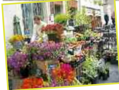
Boven: de Place Mitterrand in Cahors. Onder: de markt vlak naast de kathedraal.

tion. De kamers zijn heel 'basic', er is geen wifi, maar de nostalgische sfeer van begin 19de eeuw maakt veel goed. Bovendien is het restaurant, Le Balandre, het beste van Cahors. Je dineert er in een charmante eetzaal met art nouveau glas-in-loodramen en stijlvol gedekte tafels. Specialiteit is les oeufs Pierre Marre , of met truffel geparfumeerde eieren. Enige tegenvaller: de ronduit zenuwachtige bediening.