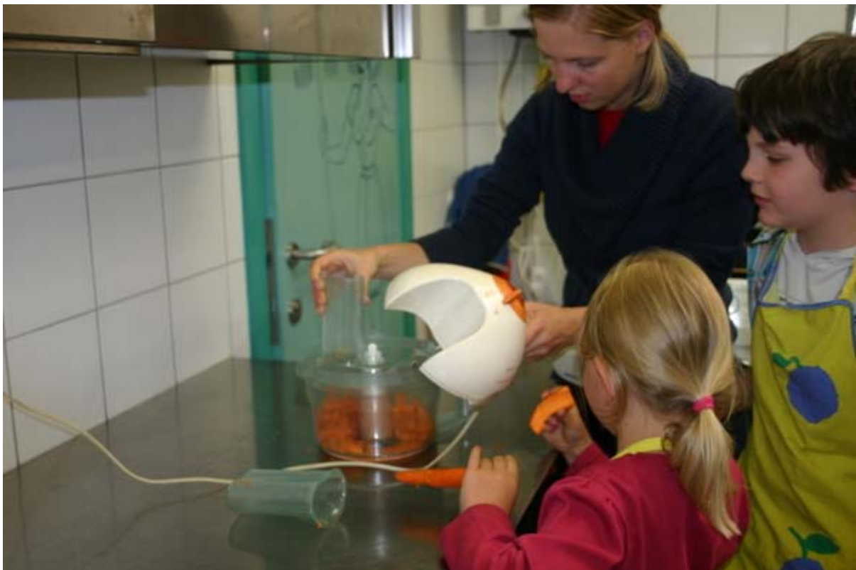
Pak de wortelen bovenaan vast en schraap. Of haal met een dunschiller van boven naar onder de schil eraf. Draai met de wortel. Snijd de boven- en onderkant eraf met een mes. Snijd de wortelen met de keukenmachine in schijfjes.