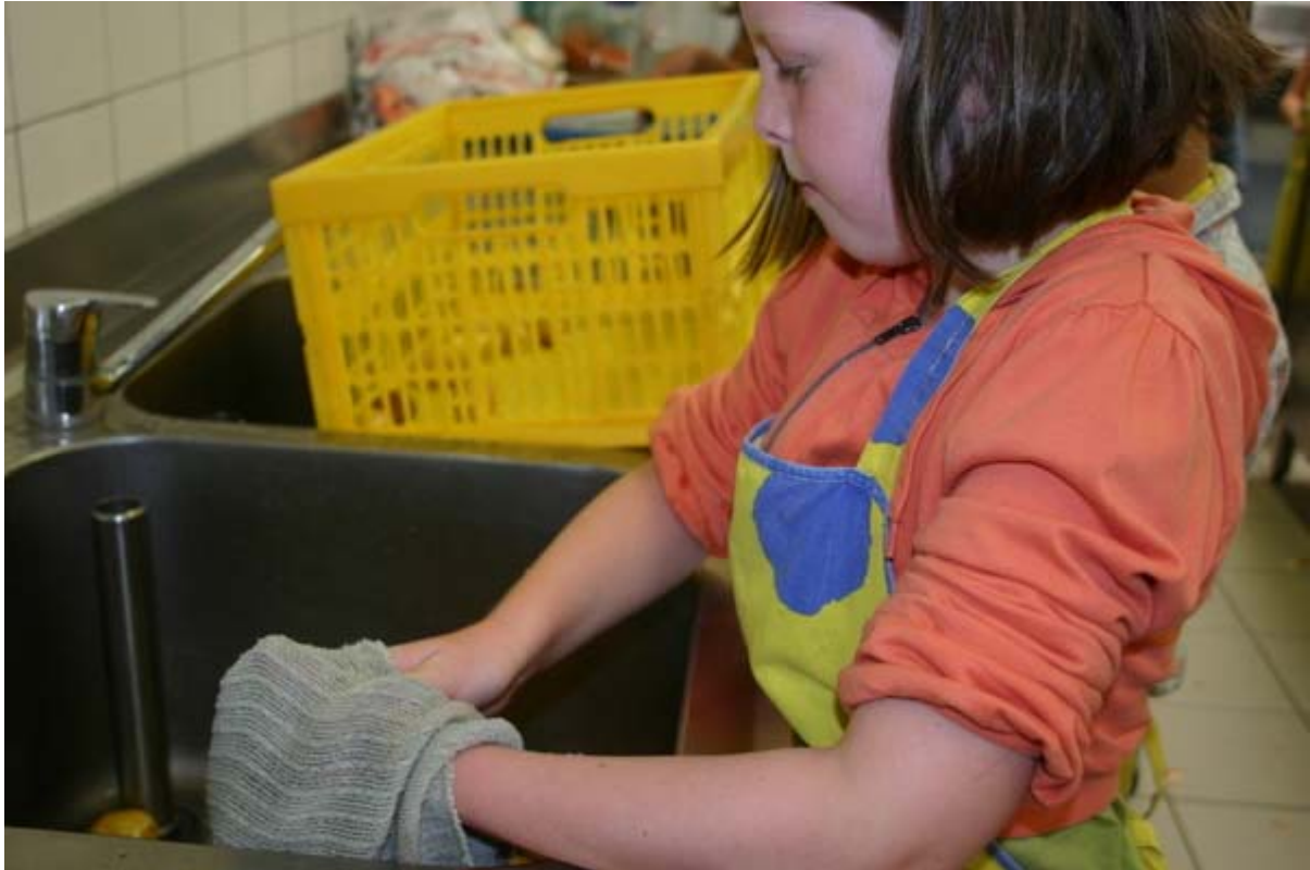
2 Wrijf ze droog met een schotelvod. Snijd in lengte in 2.