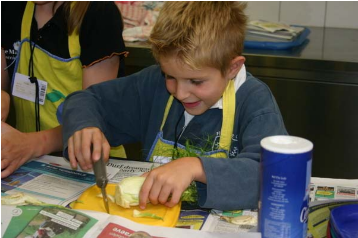
1 Snijd de venkel in kleine stukken