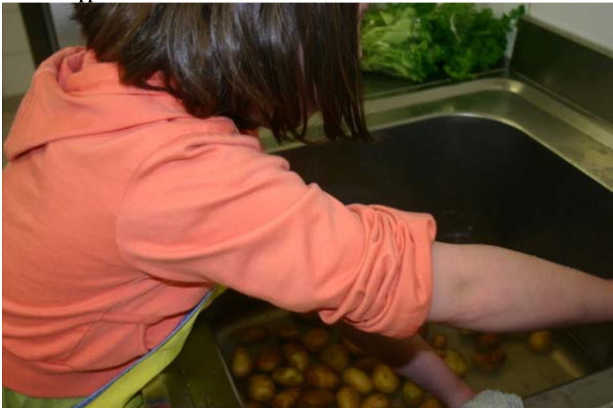
1 Was de krielaardappelen