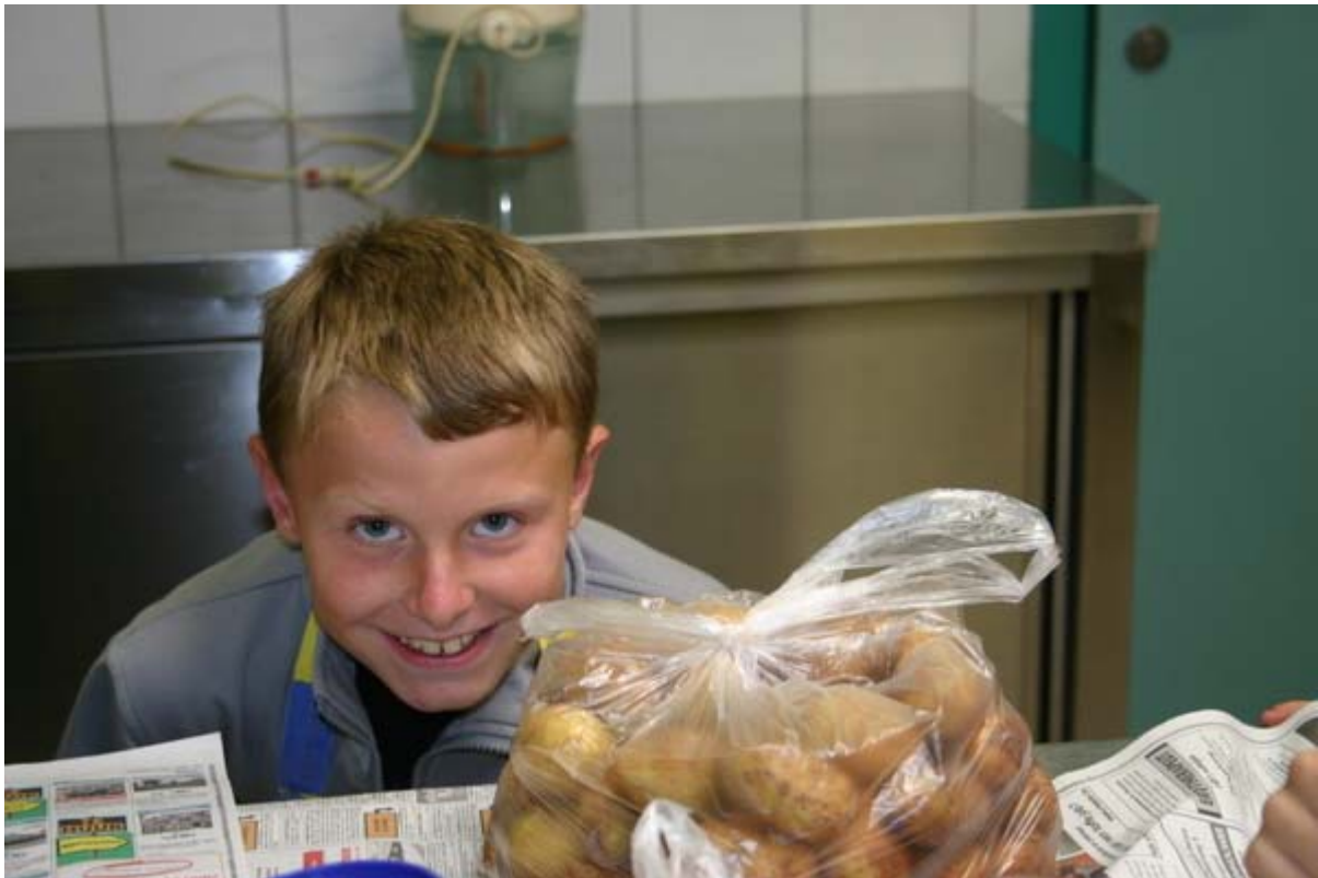
Krielaardappelen in de schil