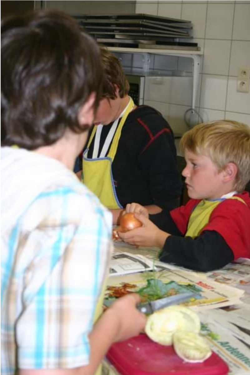
Pel de ui.