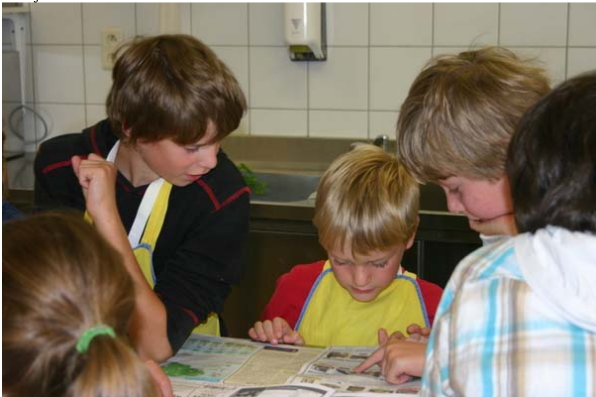
2 Leg een oude krant op het werkblad.