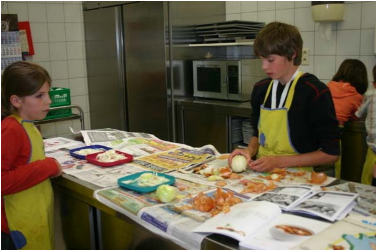
Snijd de ui in ringen. Ruim het afval op.