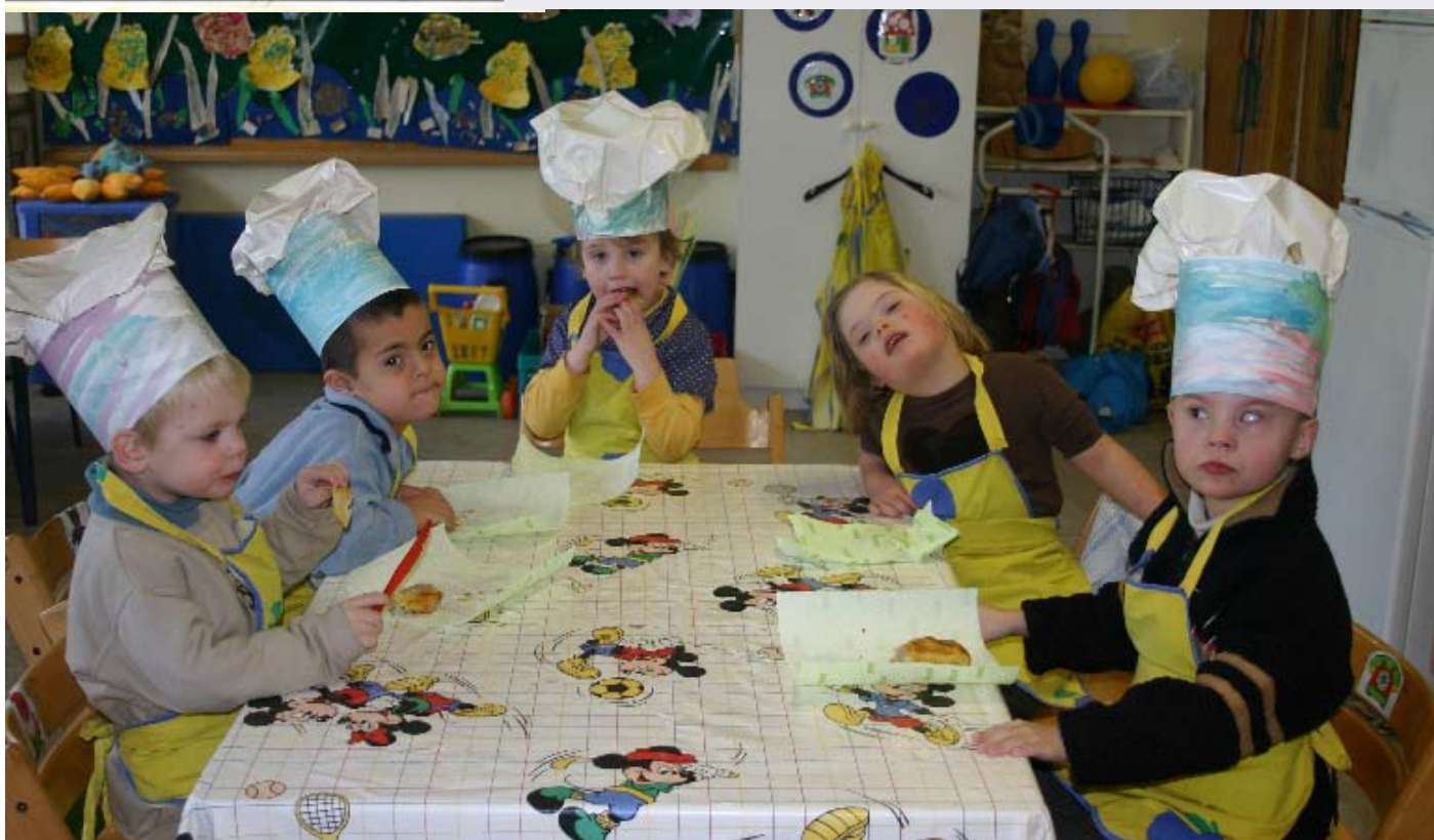
MPIGO 't Vurstjen

G: kijk eens onder tafel wie heeft zich daar nu verstopt S: 't is meneer Spaghetti hij heeft zich weer volgepropt G: hij is nu een beetje ziekjes da's normaal als je zo smult S: hij heeft buikpijn in zijn buikje maar dat is zijn eigen schuld